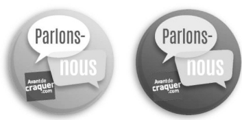
Affichés sur cette page, de gauche à droite et de haut en bas : encart publicitaire, affiche, macarons et banderole