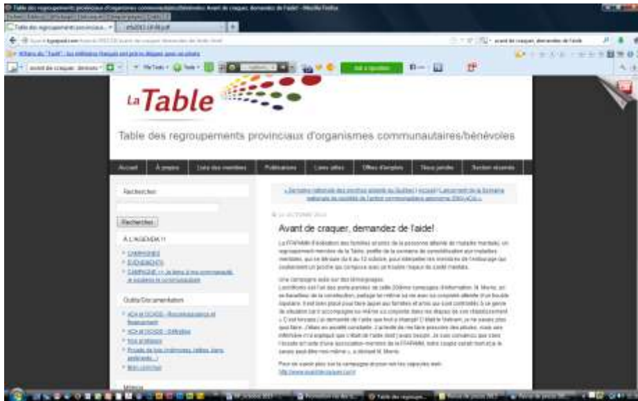
Table des regroupements provinciaux d'organismes communautaires/bénévoles

http://trpocb.typepad.com/trpocb/2013/10/avant-de-craquer-demandez-de-laide-.html